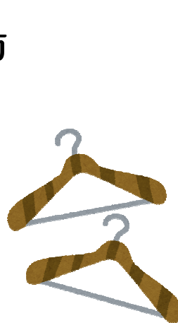
太くてしっかりとした厚みがあるものを

肩のシルエットが合っていないと、ハンガーの形に衣類が歪んだり、変なシワができる原因になりますので、お気を付け下さい。