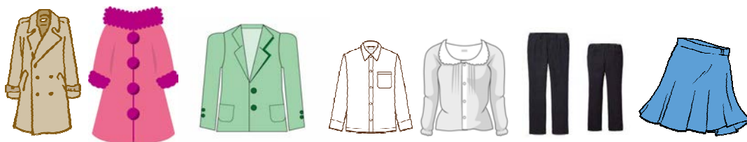
コート、ジャケット スーツ シャツ、ブラウス スラックス スカート