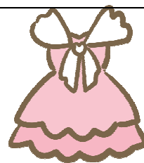
重い素材がついているもの